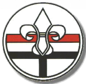
TC Nicolai Konstanz