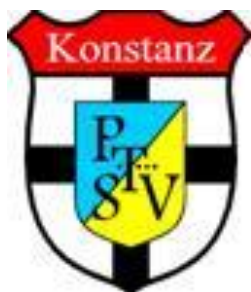
PTSV Post Telekom Konstanz