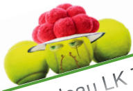
Tableau LK Turniere Ranglistenturniere LK -Tagesturniere