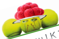
Tableau LK Turniere Ranglistenturniere LK -Tagesturniere